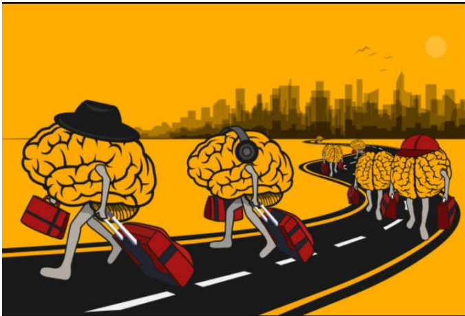
Disponível em: < https://media.istockphoto.com/id/1170180978/vector/brain-drain.jpg?s=612x612&w=0&k=20&c=i6CcYwcPa7oq4RtuyonLtwAJn74o3UyWEtt4HqQM_Cs=> >. Acesso em: 08 de out. 2023.

A imagem retrata qual fenômeno social da atualidade?